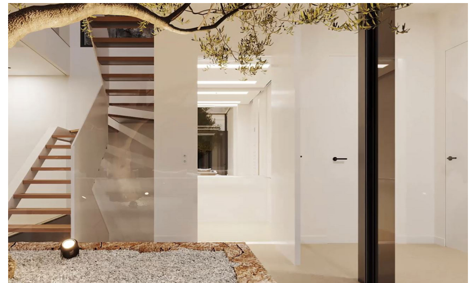
Aufzug (das Bild dient als Muster)