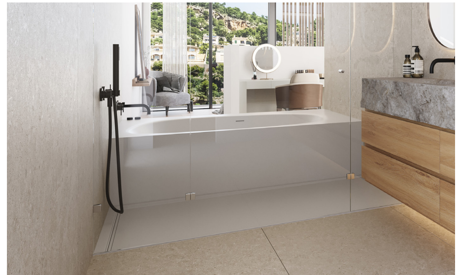
Badewanne Masterbad (das Bild dient als Muster)