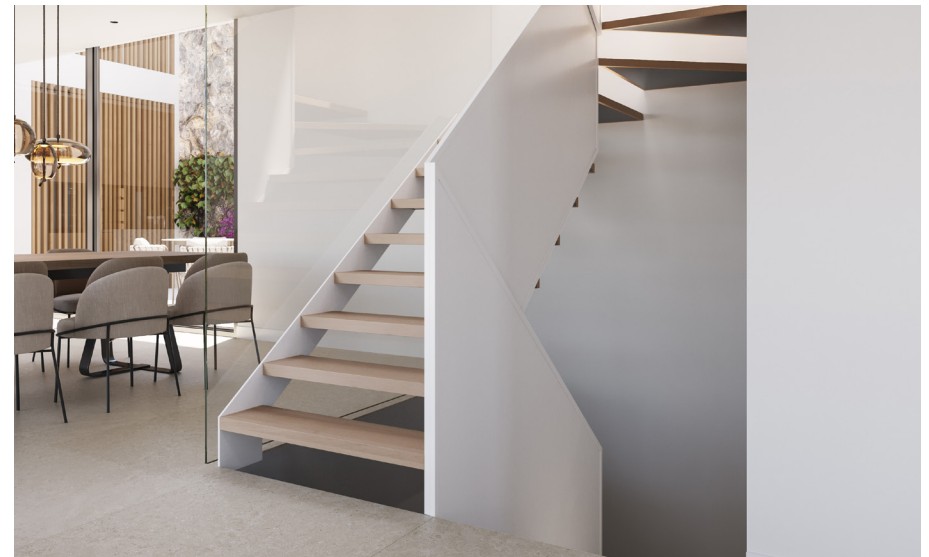
Treppe (das Bild dient als Muster)