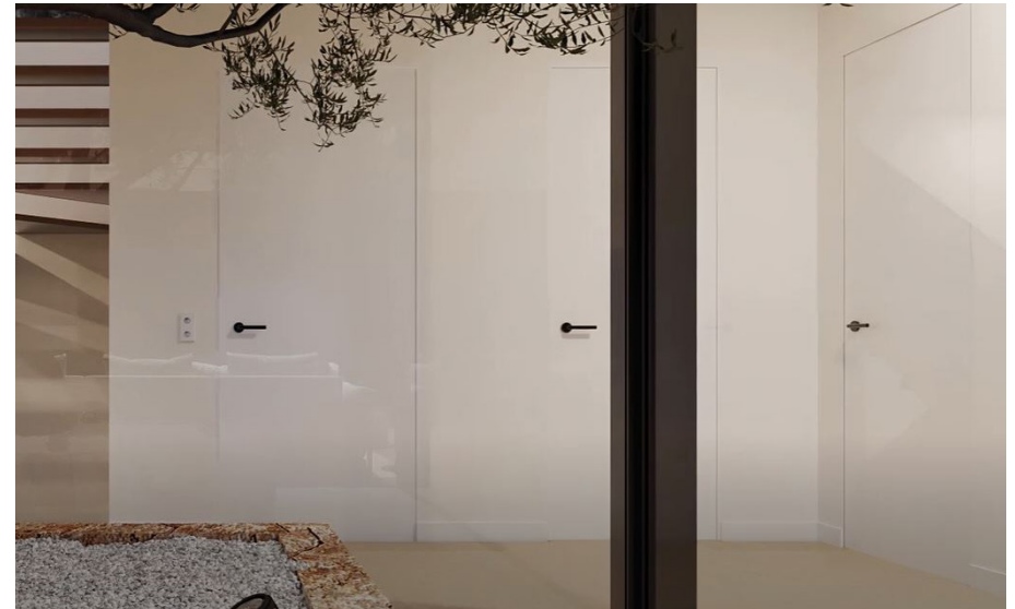
Innentüren (das Bild dient als Muster)