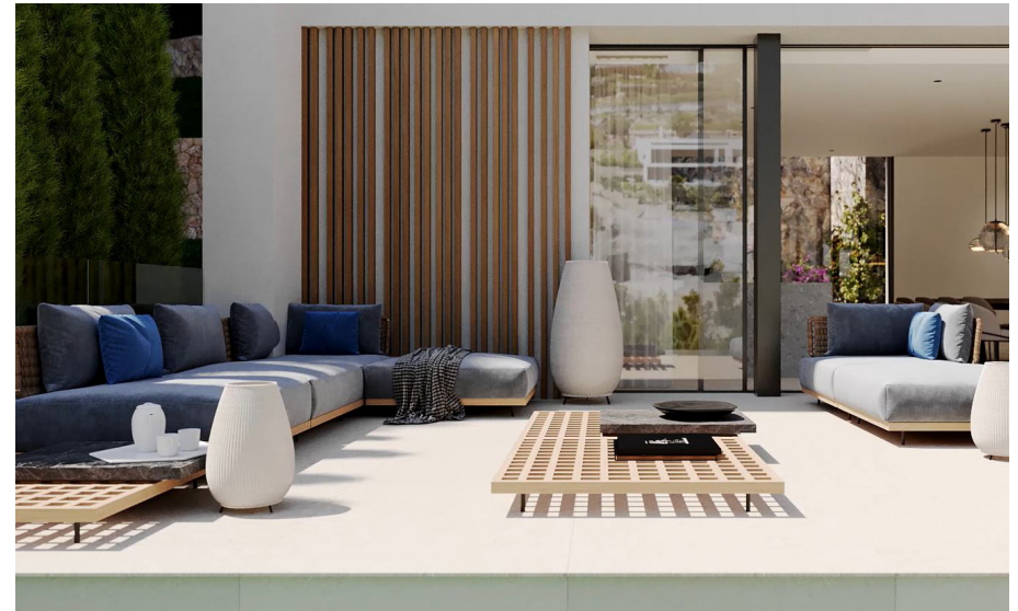
Terrassen (das Bild dient als Muster)