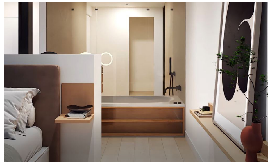
Holzarbeiten (das Bild dient als Muster)