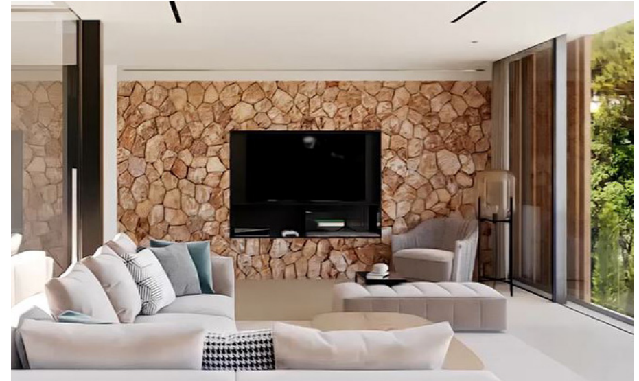
TV-Anlage samt Gasofen (das Bild dient als Muster)

Programmierung der Gebäudesteuerung durch deutsche Programmierer mit über 20 Jahren Erfahrung im Smart Home Bereich.