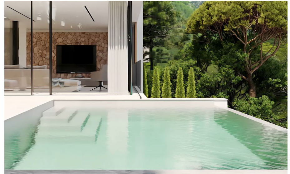
Infinity-Pool (das Bild dient als Muster)

Aufgrund aktueller Lieferengpässe können Hersteller abweichen. Die gleiche Kategorie von Herstellern wird gewährleistet.