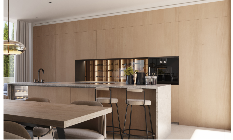
Küche (das Bild dient als Muster)